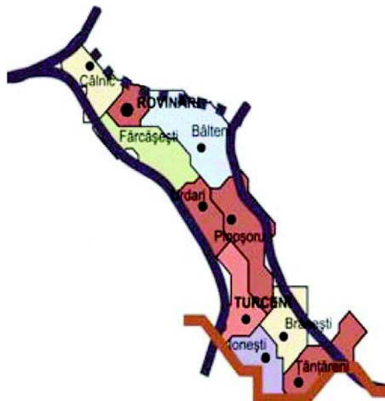
Harta nr. 2: Subzona de dezvoltare 5B

Prin H.G. 193/1999, zona Motru-Rovinari a fost declarată defavorizată și introdusă în programul special pentru zone defavorizate „Sprijinirea investițiilor”, pe o perioadă de 10 ani, conform H.G. nr.521/2000. Conform inventarului zonelor critice sub aspectul stării mediului în România, transmis Delegației Comisiei Europene, zona Rovinari e încadrată la zone critice sub aspectul poluării solurilor și al managementului defectuos al deșeurilor, în mare parte rezultate ca urmare a exploatărilor miniere.