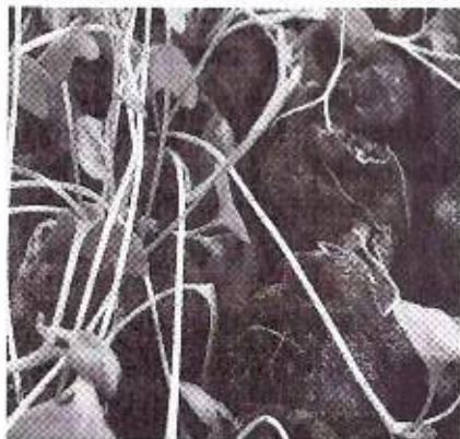
Pythium de barianum

3)Tratament in vegetatie dupa rasarirea plantulelor pana la repicare pentru combaterea complexului de agenti patogeni de rasarire : putrezirea plantulelor ( Pythium debaryanum ),mana de sol ( Phytophthora parasitica ),putregaiul uscat al coletului ( Rhizoctonia solani )